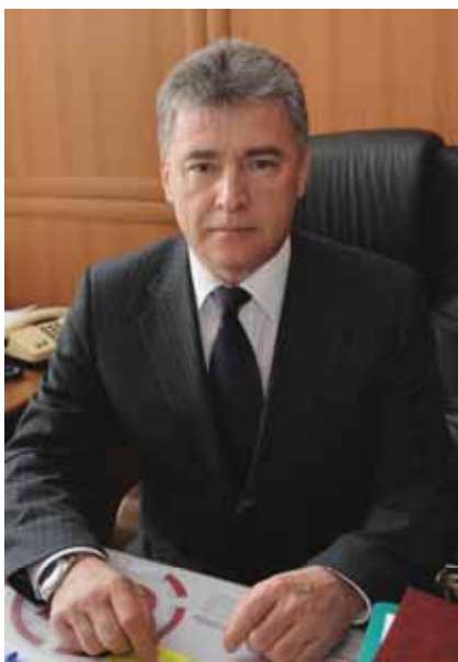
Анатолий Владимирович Бондар, председатель Комиссии Совета судей Российской Федерации по вопросам судебной практики и совершенствования законодательства, председатель Нижегородского областного суда

П ленарное заседание Совета судей Российской Федерации, прошедшее 2—4 июня 2015 г. в Москве, в определенной степени можно считать предконтрольной проверкой выполнения Постановления VIII Всероссийского съезда судей «О состоянии судебной системы Российской Федерации и основных направлениях ее развития» (далее — Постановление), принятого 19 декабря 2012 г. 1 , в котором обозначены приоритетные направления деятельности на ближайшие четыре года. Комиссия Совета судей Российской Федерации по вопросам судебной практики и совершенствования законодательства (далее — Комиссия) выступает в качестве соисполнителя в реализации столь большого объема задач.