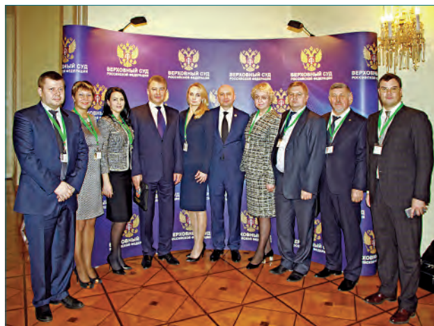
Делегаты IX Всероссийского съезда судей от Нижегородской области