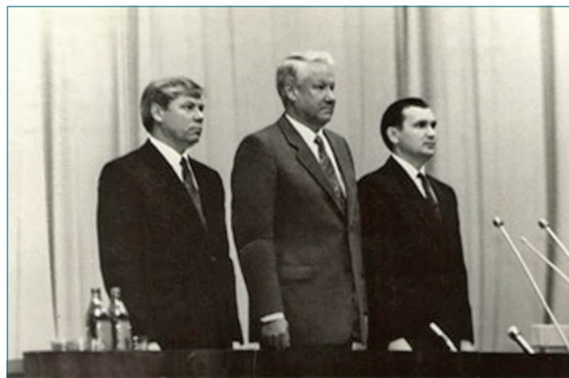
Президент Российской Федерации Ельцин Борис Николаевич на I Всероссийском съезде судей

об увольнении. А желающих стать судьей практически не было. Самое опасное заключалось в том, что ослабление судейского корпуса, происходившее на протяжении ряда лет, могло вскоре привести к его полной неспособности выполнять свои обязанности по защите прав и интересов граждан». Основное направление в работе делегатов съезда было предопределено необходимостью создания отдельной судебной ветви власти, как гарантии сохранения независимости суда от иных публичных органов государства, полное отчуждение от административного соподчинения судебных органов и приход к сугубо процессуальным взаимоотношениям между судами разных инстанций; создание состязательного процесса, основанного на равноправии сторон.