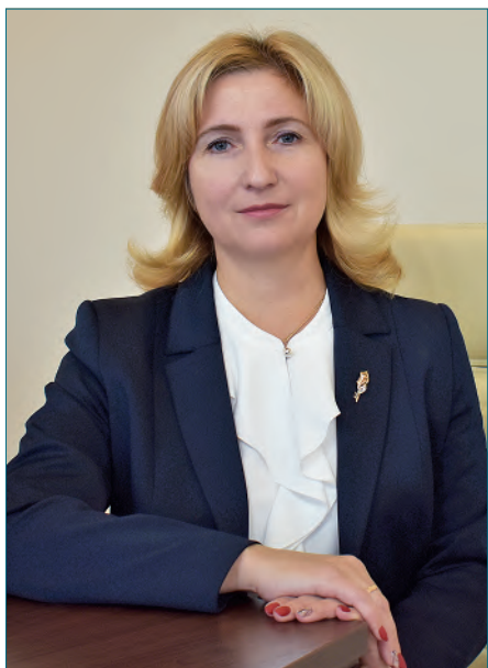
Председатель Городецкого городского суда Нижегородской области Доможирова Лариса Юрьевна

Электронное правосудие как гарант эффективного и своевременного судебного процесса: положительный опыт работы Городецкого городского суда Нижегородской области