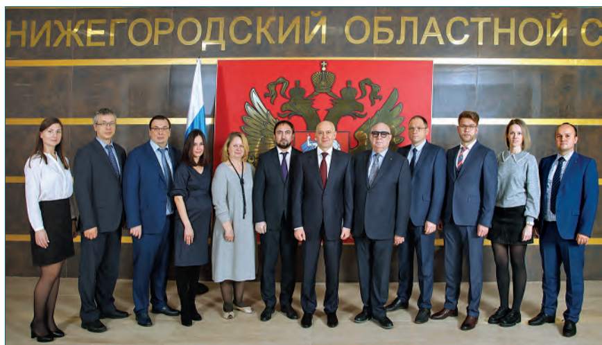
Члены экзаменационной комиссии Нижегородской области по приему квалификационного экзамена на должность судьи

ной комиссии. Сведения о ходе проведения квалификационного экзамена на должность судьи и его результатах отражаются в протоколе, который подписывается председательствующим на заседании экзаменационной комиссии, членами комиссии, участвующими в заседании.