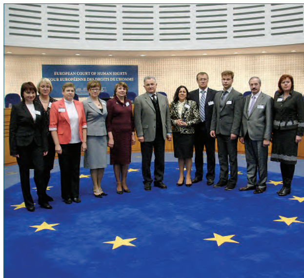
Делегаты от Нижегородской области в Европейском суде по правам человека