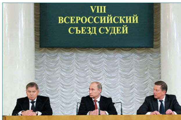
Президент Российской Федерации Путин Владимир Владимирович на VIII Всероссийском съезде судей

судья Арбитражного суда Нижегородской области