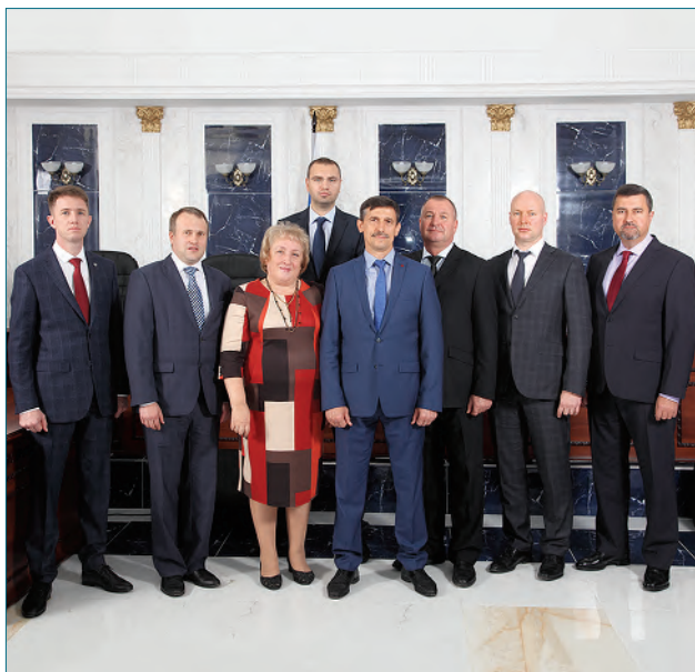
Члены Совета судей Нижегородской области

дья судебного участка №7 Канавинского судебного района г. Нижний Новгород.