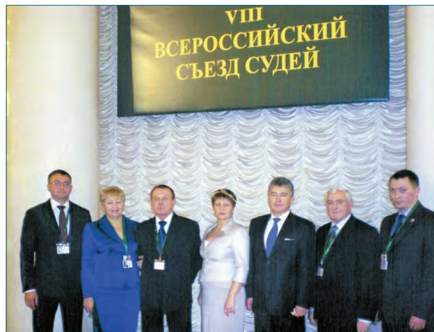
Делегаты VIII Всероссийского съезда судей от Нижегородской области с председателем Совета судей Российской Федерации Сидоренко Юрием Ивановичем

На Съезде было констатировано, что Государственная автоматизированная система Российской Федерации «Правосудие» объединила в единое информационное пространство свыше 85 тысяч автоматизированных рабочих мест более чем на трех тысячах объектов на территории всей страны. Суды оснащены компьютерной и оргтехникой, комплексами аудио- и видеопотоколирования судебных процессов, обеспечен публичный доступ к базам решений судов. Созданы интернет-сайты всех федеральных судов общей юрисдикции, на которых с 1 июля 2010 года размещаются сведения о назначенных и рассмотренных делах, тексты принятых судебных актов, иная информация о деятельности суда. Создан интернет-портал мировой юстиции: обеспечена интеграция участков мировых судей в ГАС «Правосудие». В системе Судебного департамента создано федеральное государственное бюджетное учреждение «Информационно-аналитический центр поддержки ГАС «Правосудие», основными целями которого определены, в частности, поддержка пользователей указанной автоматизированной системы; хранение и автоматизированная обработка судебной информации (включая электронные архивы судебных дел); интеграция информационных ресурсов и судебной статистики. Активно внедряются и широко используются новейшие информационные технологии в системе арбитражных судов. Так, в 2008 году создан единый «Банк решений арбитражных судов», в 2010 году – новая версия системы «Картотека арбитражных дел».