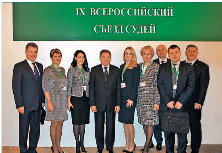
Делегаты IX Всероссийского съезда судей от Нижегородской области с Председателем Верховного Суда Российской Федерации Лебедевым Вячеславом Михайловичем

и размещения их в электронном хранилище; разработан комплекс программ «Электронное хранилище судебных документов», вошедший в состав комплекса программ «Судебное дело-производство».