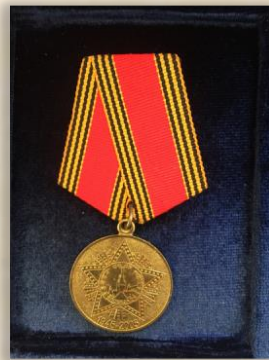
“60 лет победы в Великой Отечественной войне 1941-1945 гг.”