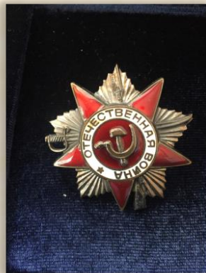
“Орден Отечественной войны I степени”