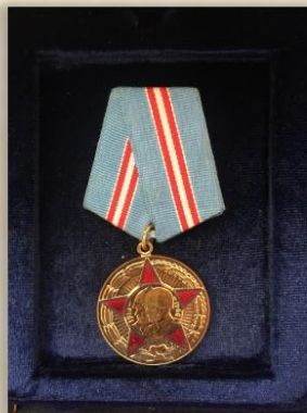
“50 лет вооруженных сил СССР”