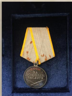
“За боевые заслуги”