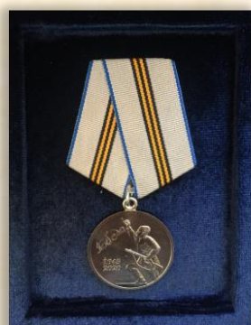
“75 лет победы в Великой Отечественной войне 1941-1945 гг.”