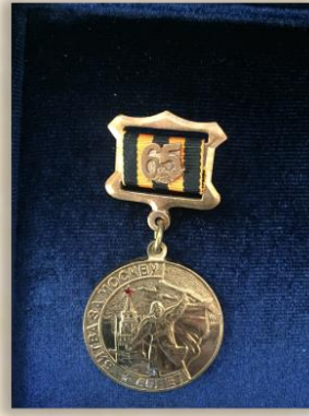
“65 лет битвы за Москву”