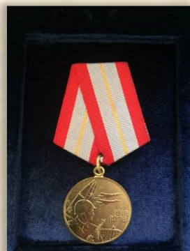
“60 лет вооруженных сил СССР”