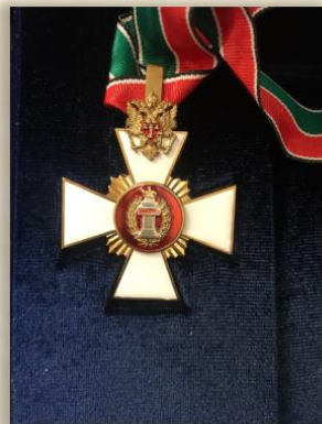
“Ветеран судебной системы”