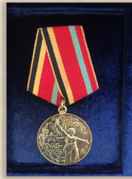
“Тридцать лет победы в Великой Отечественной войне 1941-1945 гг.”