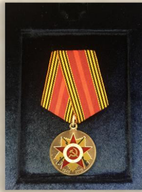
“60 лет победы в Великой Отечественной войне 1941-1945 гг.”