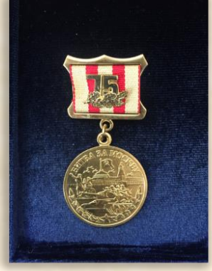
“75 лет битвы за Москву”