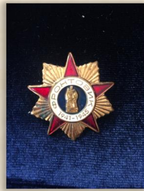
“Фронтовик 1941- 1945”

Проект Нижегородского областного суда «Наши ветераны»