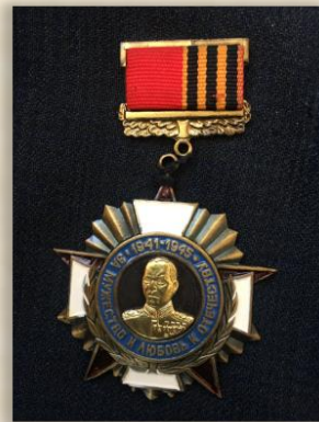
“За мужество и любовь к Отечеству”