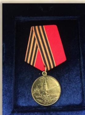
“50 лет победы в Великой Отечественной войне 1941-1945 гг.”