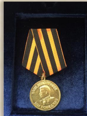
“За победу над Германией в Великой Отечественной войне 1941-1945 гг.”