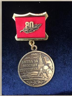
“80 лет битвы за “Заслуженный ветеран” Москву”