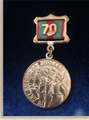
“70 лет битвы за Москву”