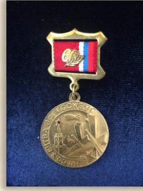
“60 лет битвы за Москву”