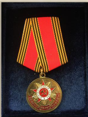
“65 лет победы в Великой Отечественной войне”