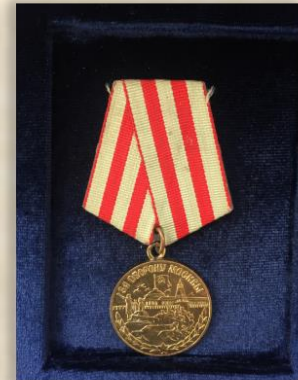
“За оборону Москвы”