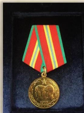
“70 лет вооруженных сил СССР”