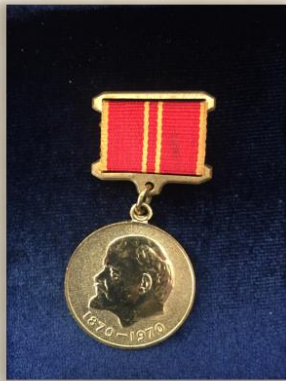
“За доблестный труд. В ознаменование 100-летия со дня рождения Владимира Ильича Ленина”